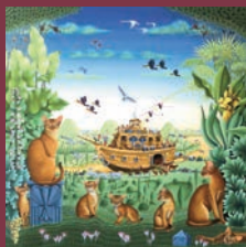
L'Arche de Noé