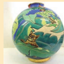
Les enfants du Paradis

La conférence qu'il donnera le mercredi 20 mars 2019 à 14h30 dans le cadre du colloque « L'Amour des animaux / Animal Love » à l'Hôtel d'Assézat, salle Clémence Isaure portera sur : L'homme et le chat : une histoire et un avenir communs ? (Des origines à l'intelligence artificielle).