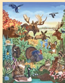
Mon rêve d'Amérique