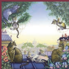
Sur les toits L'Afrique

Une exposition de quelques-unes de ses œuvres se tiendra dans la salle des conférences de l'Hôtel Dumay (Musée du Vieux Toulouse), rue Dumay, pendant la durée du colloque